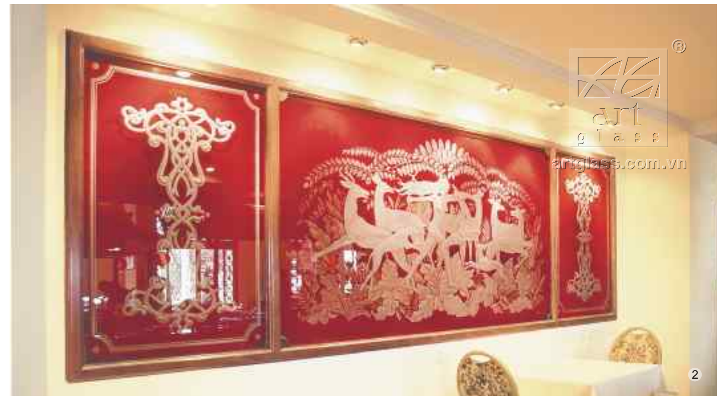
Đề tài trang trí kính chạm khắc rất phong phú và gần như vô hạn. Từ tranh “Diana” (Hình 2) của khách sạn 5 sao Majestic, họa tiết trang trí trên cửa nhà hàng Ngọc Sương (Hình 1), cho đến đề tài thiên nhiên như biển sóng (Hình 3) cho phòng tắm sự riêng tư lãng mạn, đều có thể tái hiện bằng nghệ thuật khắc kính.